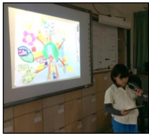
情意課程：探索我的世界