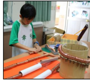
磁浮列車軌道設計